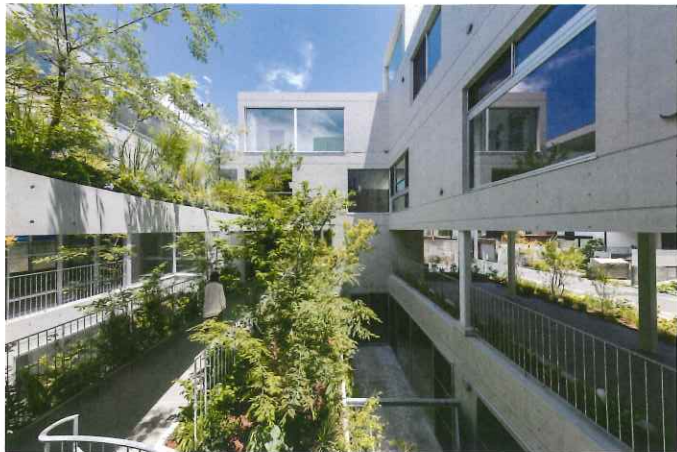
「集まって住むこと」で得られる大きな中庭*。

建築主 コートテラス都立大学建設組合 表彰建築士事務所 一級建築士事務所奥野公章建築設計室 施工 株式会社河津建設 所在地 東京都目黒区 主要用途 共同住宅 構造 RC造 階数 地上3階、地下1階、塔屋1階 敷地面積 667.96㎡ 建築面積 369.32㎡ 延床面積 1,177.42㎡ 竣工 2022年6月